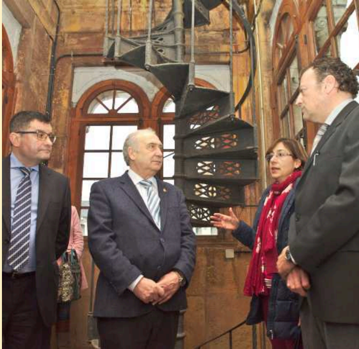
Los representantes de AEMET hablan con el rector

En el caso de la movilidad, la meteorología es la segunda causa más frecuente de atascos, de ahí la importancia de disponer de predicciones lo más exactas posibles.