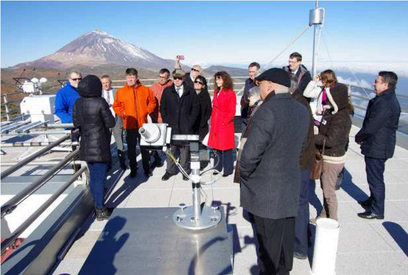
Los asistentes, durante la visita a las instalaciones