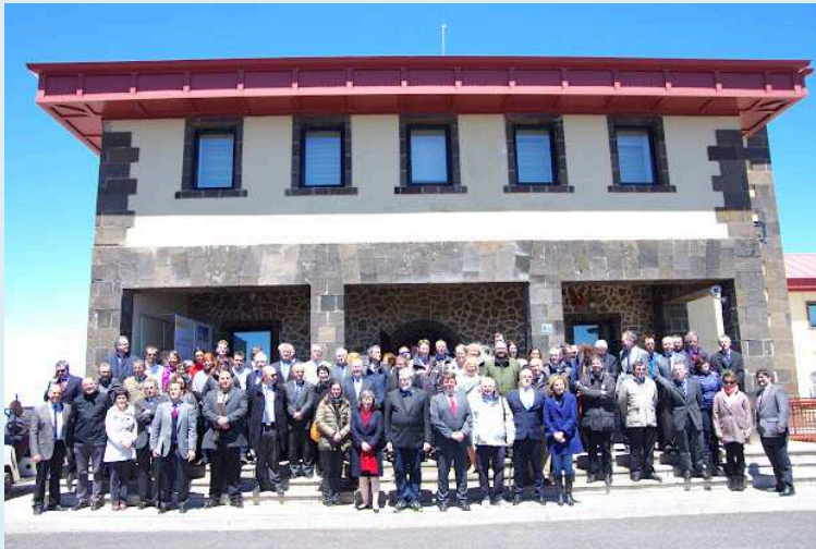
Los asistentes a la celebración, ante la sede del observatorio