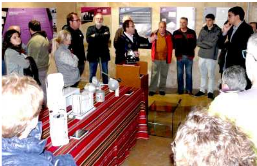
Visita guiada a la exposición de Morella