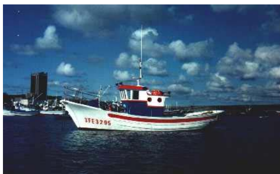
Figura 1. Embarcación MONTEAGUDO PRIMERO