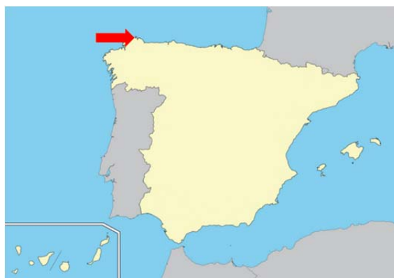
Figura 2. Zona del accidente